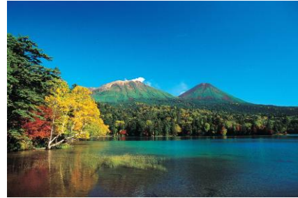
▲阿寒摩周国立公園の最西端に位置するオンネトー。

今までの生活とかけ離れた空間、大自然は新鮮で衝撃でした。本当に大きな木、動物を見ていると自分がせまい箱の中にいた事を感じます。パティシエの職業は箱の中でずっと同じメンバーでワンチームとなって作業を繰り返すので、視野が狭くなってしまう傾向があります。十勝に来て、自然や十勝の人を見ていると小さな世界で生きてきた自分の殻がバラバラと剥がれていく感覚がありました。