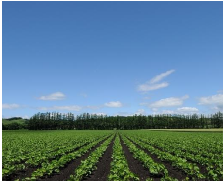
▲本別町は日本一の豆のまちといわれ、良質な豆の産地として高い評価を受けています。

かなり単純な理由ですがハンターやるなら北海道かなという理由で山梨から江別市へ移住しました。その後、江別市で銃猟免許と猟銃所持の準備をして本別町へ移住しました。