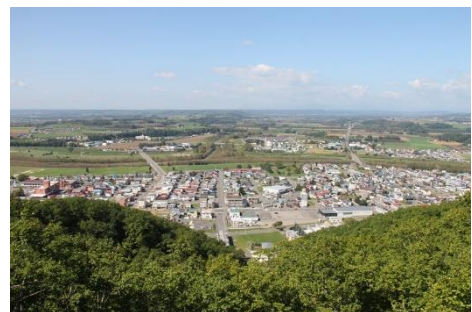
▲市街地と本別公園を隔てている神居山には、町民の手で整備された遊歩道があり、山頂の展望台からは、天気の良い日には日高山脈までも一望することができます。

生活するのには特に困る事はないです。施設が揃っており、生活必需品以外のちょっとしたものが必要になれば、帯広まで行けばだいたいの用を足すことができますので、生活に不便を感じることは特にありません。