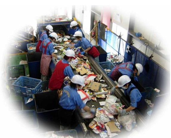
紙製容器包装物の手選別作業状況