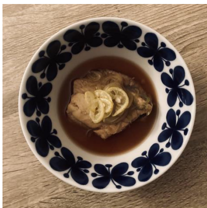
▲頂き物のカレーを初めて自分でおろし、煮物にして食べた。

野菜の味が東京にいたときに食べていたものとは、全然違います。そのため、スーパーで野菜を買うことがほとんどなくなりました(買うとしてもきのこくらい!)。道の駅や直売所で買う事が多いですが、農家さんと仲良くなれば、季節のものをもらえ、とてもありがたいです。また、大樹町は港もあるので魚も安く、新鮮でとても美味しいです。