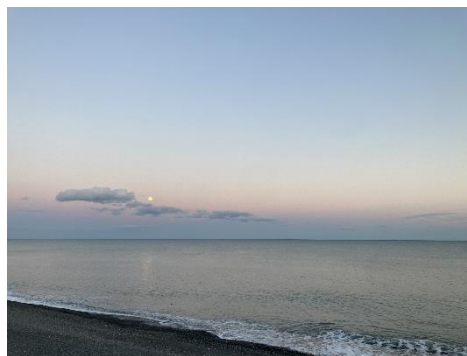
▲旭浜から望む夕焼け。この日はたまたま満月だった。

「北海道に移住したい」とずっと思っており、特に北欧に似ている道東は自分の求めている環境でした。環境だけでいえば、斜里や網走、弟子屈、阿寒、津別などのオホーツク管内(とその境目)が特に好きだったのですが、やりたいことができれば意味がない。「自分のやりたい本に関する仕事ができるまち」という観点で探しはじめ、このまちなら！と感じたのが、大樹町でした。