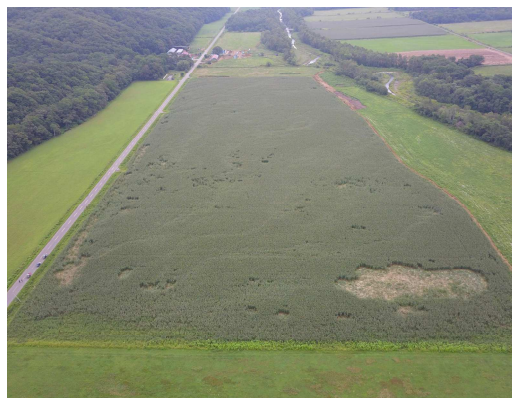
📷 デントコーン畑の被害状況の写真

近年、東北地方を中心として耕作放棄地や過疎地の増加と人身被害が増加していることからクマ被害が注目されています。今後はクマが生息する地域と人の生活圏地域、クマと人が遭遇する可能性のある緩衝地域などを設定するゾーニングマップの作成のための現地調査を行い、大樹町の安全に貢献できればと考えています。