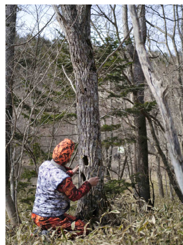
現場で生物調査をしている様子

大樹町の猟友会の方から声かけがあり、地域おこし協力隊有害鳥獣対策支援として大樹町にやってきました。