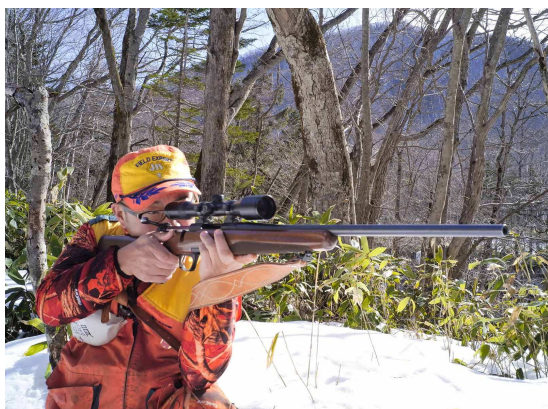
エゾシカを狙う様子

調査で山に入っていた時にあるハンターに安全管理の為に同行して貰いました。その猟師の語る山野の歩き方や鳥獣や野草の知識に感銘を受け、私自身も猟師になることを決意。猟友会帯広支部に入会し、猟師として地域の課題に向き合ってきました。